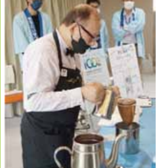
「コーヒーをコーヒーでこす」

福岡市はより良質な水を提供するため「安全でおいしい水道水プロジェクト」を行っている。国が水道法で義務化している51の水質検査項目に加え、市独自で150項目以上実施している。さらに、水質基準を満たす範囲で塩素量を極力少なくしている。そうすることで水の風味を残し、安全でおい