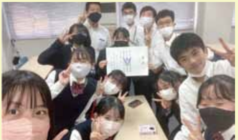
県大会では優秀賞を獲得

年の垣根を越えて、協力して新聞制作するので、上下関係も厳しくなく、和気あいあいとした雰囲気です。文章力は記事作成を重ねることに自然と磨き上げられます。文章力に自信がない人やコミュニケーションを取ることが苦手な人でも心配することはありません。 私たちは昨年度の県大会で優秀賞を、そして全国年間紙面審査賞を受賞し、今年度の全国大会への出場が決定しました。今大会で新聞部は14年連続の全国大会出場となります。 新聞部は大変なことも多く忙しいですが、完成した新聞を多くの生徒が読んでいる姿を見たときは、この上ない達成感と満足感を感じることが出来ます。部室はスカイチューブを渡って右、西館3階にあります。新聞部に興味のある方はぜひ一度足を運んでみてください。