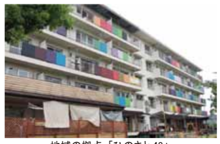
地域の拠点「ひのさと48」

日の里団地は、高度経済成長期の1971年に政府が設立した特殊法人日本住宅公団によって開発された。総面積は約217・6haの広さを誇り、団地の中では九州最大級だ。これは福岡Pay Payドーム31・4個分の広さにもなる。団地の南部は国道3号線、北部はJR鹿児島本線東郷駅、国道495号線に隣接している。北九州にも福岡にも通勤・通学可能な立地にある。そのため、多大な人気を博し最盛期には、約2万人が居住していた。