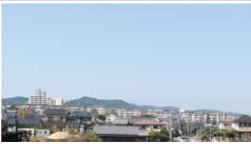
日の里団地の外観

「さつくり48」は地元の人たちを主役とする日の里団地再生プロジェクトである。解体予定だった日の里団地48号棟を「ひのさと48」として改装し、プロジェクトの拠点の一つとした。「ひのさと48」は2021年5月、「地域の会話を増やす場所」をコンセプトに地域の結節点となる施設として開業した。 例えばひのさと48の103号室にある「みどりもゆかり」は、東邦レオと西部ガスが運営するカフェだ。地元の食材を使用した料理を提供し、地域の家族連 れに人気がある。同じ1階に子どもたちが遊べるスペースがあり、大人が食事を楽しむ間に子どもたちが遊ぶことができる。その他にも広場でヨガ教室などのイベントを実施している。 さらに、県の補助金を活用してコードウイングスペース「さとのひ WONDER BASE」が2003・2004号室に造られている。利用者が接点を持ち、共に仕事をすることで、地域の課題を解決していくきっかけとなる場所を目指している。この施設には昨年6月、4つの事業者が契約した。