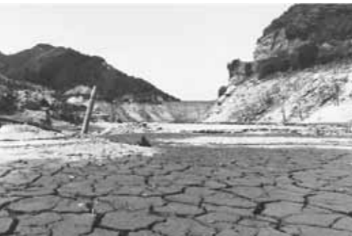
1978年に干上がった南畑ダム

福岡市水道局は大渴水を教訓とし、水資源開発や有効利用を盛り込んだ計画を立て、節水型都市づくりを進めた。1981年に水道管を流れる水の量や水圧を制御する配水調整システムを導入し、水管理センターの運用を始めた。また、198