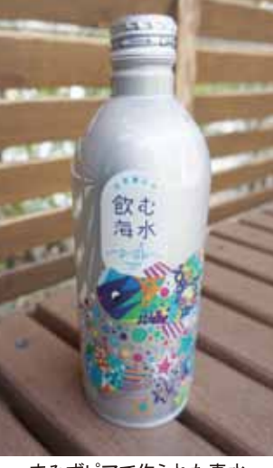
まみずピアで作られた真水

福岡市植物園正門から入り、左手の展望台に向かって進んだ所に、新しくボタニカルライフスクエアという施設が造られた。イベントや会議、研修などで使用できる施設で、3月10日に開業した。壁が少なくて開放的な造りで、広い芝生広場を一望できる。以前植物園の主なイベントは正門隣、緑の情報館2階の会議室で行っていた。新施設では芝生広場からイベントなどの活動に注目してもらうことができる。3月10日から12日にかけて、オープニングフェアが開催された。右記の「コーヒーワークショップ」はその一環だ。その他にも、一人一花運動の拠点として、植物やSDGsに関する様々なイベントや展示が行われた。