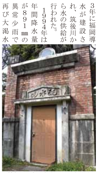
植物園にある浄水場の配水池跡

3年に福岡導水が建設され、筑後川から水の供給が行われた。1994年は年間降水量が891mmの異常少雨で再び大渴水となり、295日間給水制限が行われた。だが、これまでの対策が功を奏し、給水車は出動しなかった。福岡市の水道事業は、早良区の曲淵ダムと、現在の福岡市動植物園の位置にあった平尾浄水場の完成と同時に1993年から始まった。平尾浄水場は、夫婦石浄水場が完成する前年の1976年まで使用された。福岡市は、その後人口増加に伴い19回もの拡張事業を行った。そして、2021年に那珂川市・佐賀県吉野ヶ里町に五ヶ山ダムが完成し、福岡市関連ダムの水