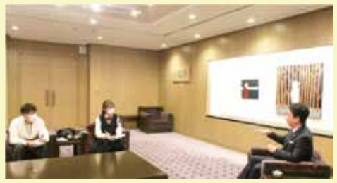
高島市長にインタビュー