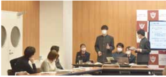
前日までプレゼンの予行に励んだ

今年の議題は、現常任委員の多くが選挙公約として挙げている、髪型に関する校則改定だ。まず執行部の常任委員が校則の改定案などを先生方にプレゼンし、次に先生方から執行部へ、