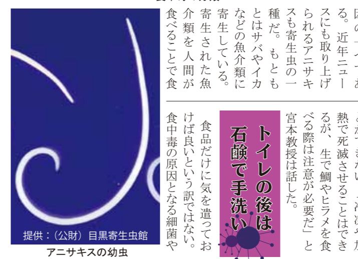
アニサキスの幼虫