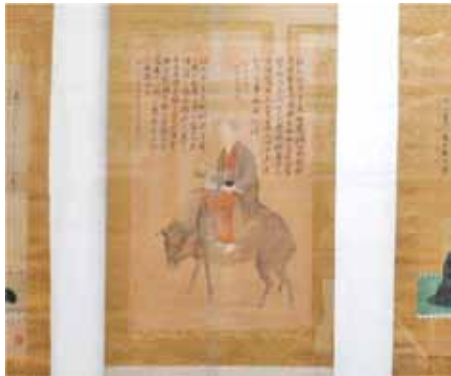
馬ではなく牛に乗る

乱は眼科医として病気を治す一方で、亀井南冥が開いた亀井塾で古学を学んだ。尊王派の志士たちと共に学び、交流していくことで幕藩体制に疑問を持つようになつていった。それと同時に、眼科医としての情熱は冷めていき、医者として過ごすよりも人々と