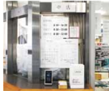
予定表や意見箱が並ぶ

具等があれば意見箱に投書してほしい。商品名が分からない場合は写真でもいい。遠慮せずに伝えてくれれば入荷につながるかもしれない。皆さんの要望を待っている」と語った。 新学年になり、新たに必要になるものも多いだろう。皆さんも一度、売店に足を運んでみてはどうだろうか。