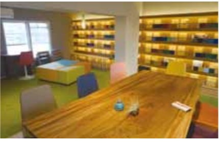
アイデアが生まれるコドウイングスペース

定めており、その実現に向けて土地利用などの規制・誘導を行っている。 宗像市は2015年に策定した第2次都市計画マスタープランで「コンパクトで魅力的な地域がネットワークする生活交流都市」を目指すべき都市像として掲げた。商業施設や医療・福祉施設を集めて、コミュニティが持続的に確保されるように、居住の密度を高め、また全体として必要な都市機能の維持と新