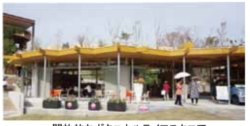
開放的なボタニカルライフスクエア

福岡市植物園正門から入り、左手の展望台に向かって進んだ所に、新しくボタニカルライフスクエアという施設が造られた。イベントや会議、研修などで使用できる施設で、3月10日に開業した。壁が少なくて開放的な造りで、広い芝生広場を一望できる。以前植物園の主なイベントは正門隣、緑の情報館2階の会議室で行っていた。新施設では芝生広場からイベントなどの活動に注目してもらうことができる。3月10日から12日にかけて、オープニングフェアが開催された。右記の「コーヒーワークショップ」はその一環だ。その他にも、一人一花運動の拠点として、植物やSDGsに関する様々なイベントや展示が行われた。